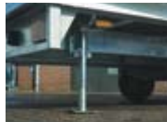
Rohrschiebestützen bzw. Schwenkbare Kurbelstützen