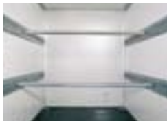
Absperrstange mit Leisten (Option)