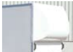
Spoiler für Holzkoffer (Option) Handgriffe serienmäßig am Holzkoffer