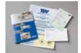
Umfangreiche Garantie/ Saris TÜV zertifiziert