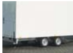
Niedriges Fahrgestell (bei Alukoffer)